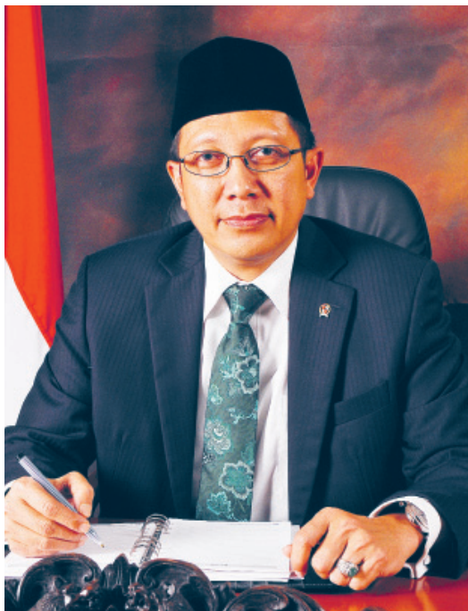
Lukman Hakim Saefuddin Menteri Agama Republik Indonesia