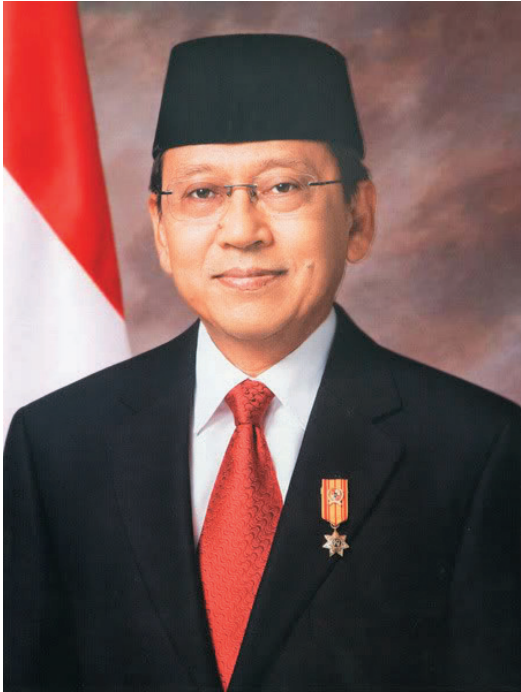
Prof. Dr. Boediono, M.Ec. Wakil Presiden Republik Indonesia