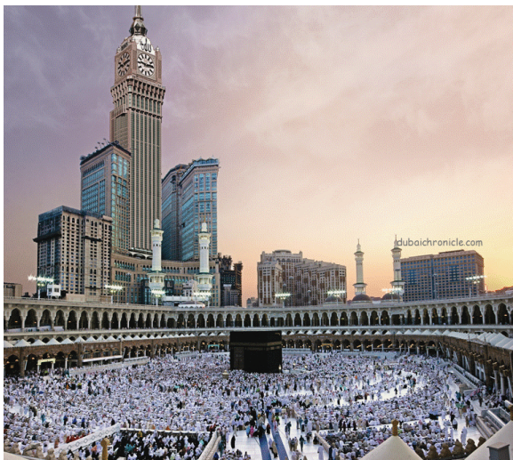
Masjidil Haram, Makkah