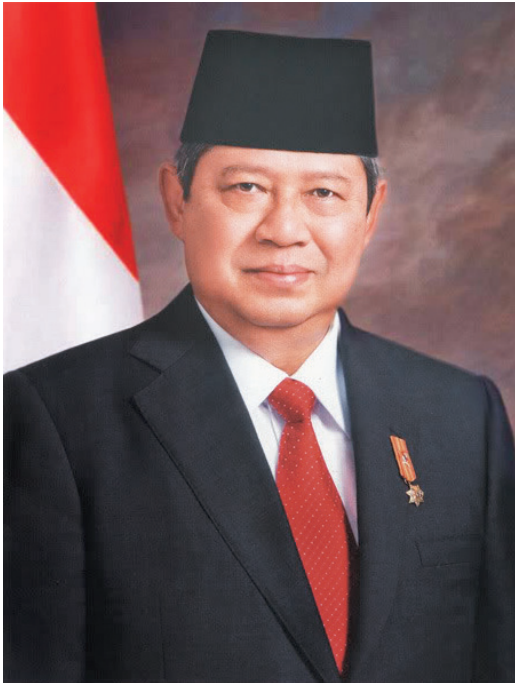
Dr. H. Susilo Bambang Yudhoyono Presiden Republik Indonesia